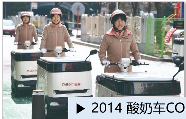
▶ 2014 酸奶车COCO