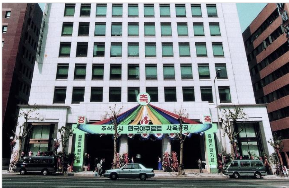
▶ 1996 总部大楼