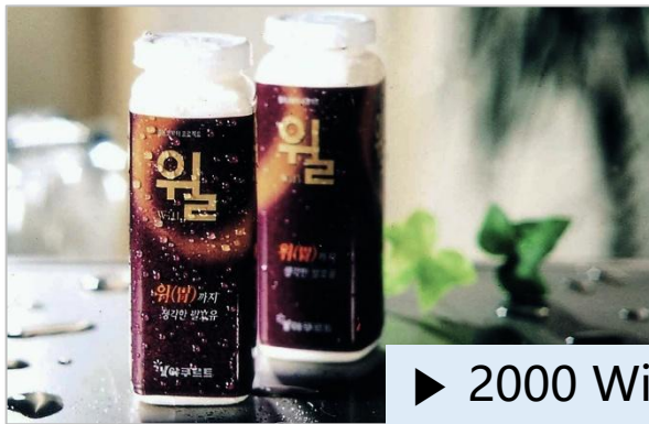
▶ 2000 Will